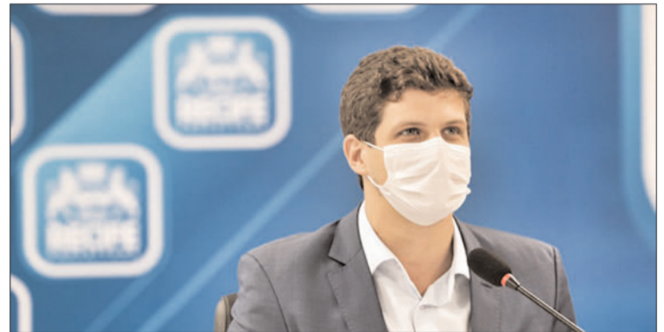
O prefeito João Campos, a partir da publicação no Diário Oficial da quinta-feira (15), assina o decreto que estabelece o marco legal da Estratégia de Transformação Digital do Recife

Dentre os princípios norteadores que fazem parte da estratégia da transformação digital está a desburocratização do acesso aos serviços. Faz parte desse conjunto de mudanças a modernização, o fortalecimento e a simplificação da relação entre o poder público municipal e o cidadão, a partir de serviços digitais de linguagem de fácil entendimento disponíveis, inclusive, por meio de dispositivos móveis. "Nosso objetivo é gerar uma interlocução ainda mais direta entre a prefeitura e o cidadão a partir de espaços digitais seguros, de fácil navegação e que permitam uma experiência resolutiva para o usuário. A gente já conta com alguns produtos que são fruto dessa necessidade de