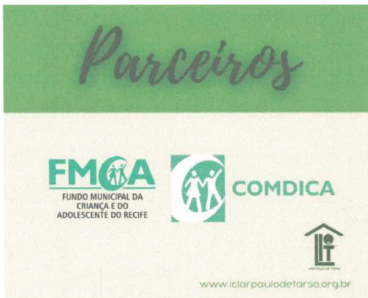
Banner da parceria no site da Instituição.

Procedimento Administrativo 01776.001.312/2021-0013 do Ministério Público, Recomendação nº 001/202 da 32ª PJDCC.